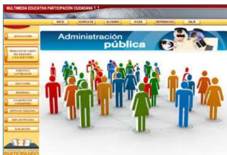
Figura 1. Interfaz inicial de la multimedia educativa de participación ciudadana

En este orden se propone el uso de la Multimedia Educativa de Participación Ciudadana (figura 1), producto informático de escritorio y software propietario, basada en el uso de las Tecnologías de Información y la Comunicación en el proceso de Enseñanza-Aprendizaje que permite a estudiantes y profesores del Diplomado de Admiración Pública y otros actores de los Órganos Locales del Poder Popular, consultar la bibliografía básica y vigente, de manera que responda de forma coherente a los objetivos de la misma y contribuya a la profundización del contenido, para alcanzar la formación esencial en su vínculo con la realidad sobre la cual actúan los funcionarios públicos, por lo que se agrupan en ella los elementos de la participación ciudadana cubana, satisfaciendo una necesidad de aprendizaje de los actores del gobierno y la administración pública.